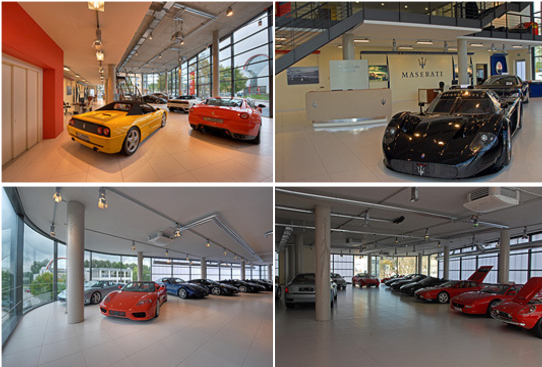
Text: Jan-Christian Richter