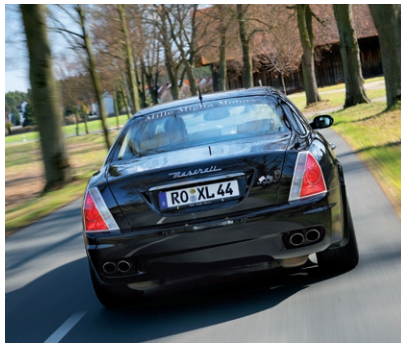
Konzert mit vier Bläsern: Der pompöse Sound animiert zum Dahinschmelzen